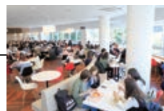
▲ASIA PLAZA 2F フリースペース Free Space in ASIA PLAZA 2F

The student cafeteria is located on the first and second floor. Its warm and relaxing design allows students to comfortably enjoy their meals. The third floor space is suited for various learning styles, such as group study or active learning. It is also referred to as “PLAZA COMMONS,” where students can relax and casually engage in their studies as well as extracurricular activities while having drinks and snacks.