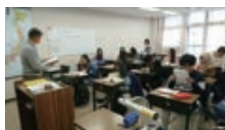
▲8号館 留学生別科の教室 Class: Intensive Japanese Course