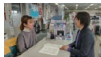
▲8号館国際交流センター International Center