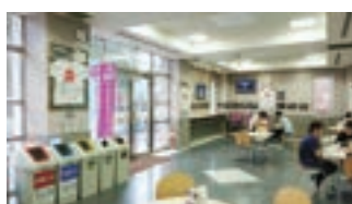
▲8号館 国際交流ラウンジ International Lounge