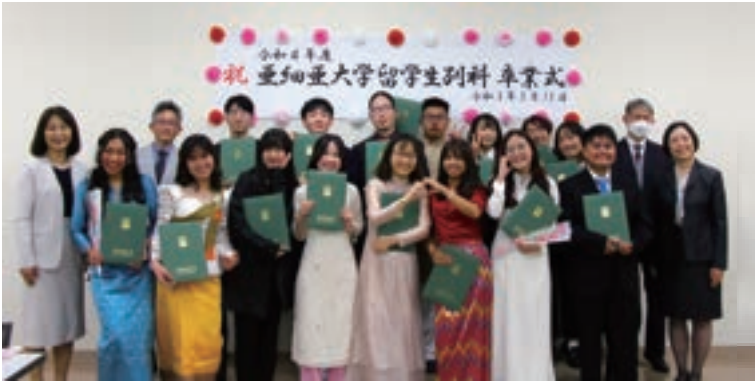
Students Recommended to Enter Asia University in 2023